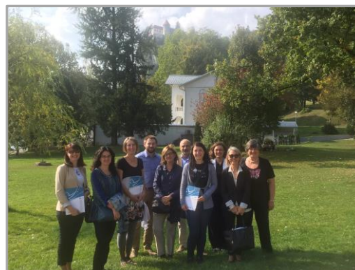
Na zdjęciu członkowie konsorcjum projektowego w Bledzie.

Celem zorganizowanego przez Premiki spotkania, które odbyło się w słoweńskich miastach Lublanie i Bledzie, było omówienie prac dotyczących pakietów szkoleniowych i multimedialnych materiałów edukacyjnych. W spotkaniu wzięł udział burmistrz Bledu, który wyraził uznanie dla idei projektu oraz dla promocji „turystyki bez barier”, która jest też podstawowym celem bledzkich władz miejskich.